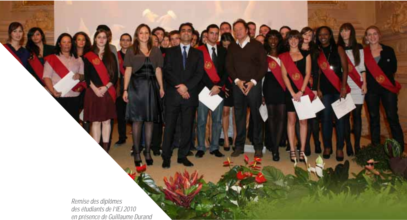
Remise des diplômes des étudiants de l'IEJ 2010 en présence de Guillaume Durand