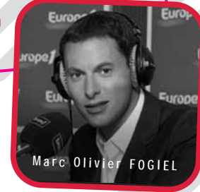
Marc Olivier FOGIEL