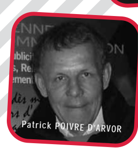
Patrick POIVRE D'ARVOR